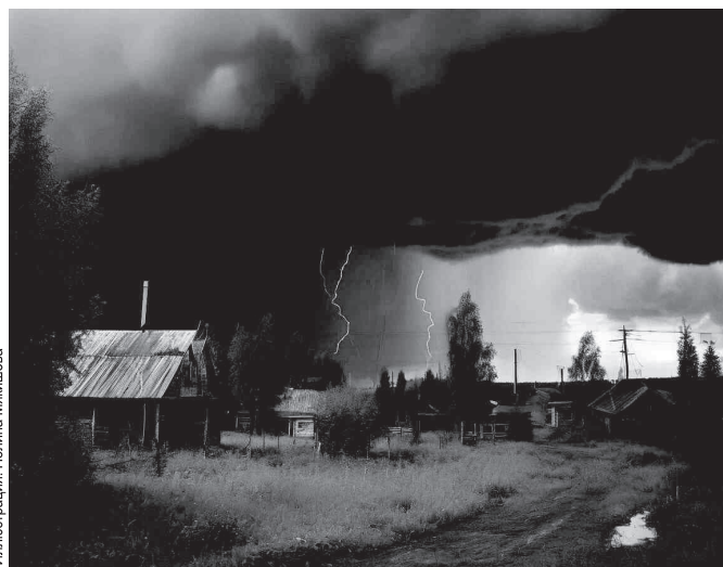
Иллюстрация: Полина Малишева

Научите вашего ребенка в случае чрезвычайной ситуации звонить в службы экстренной помощи: 101 или 112.