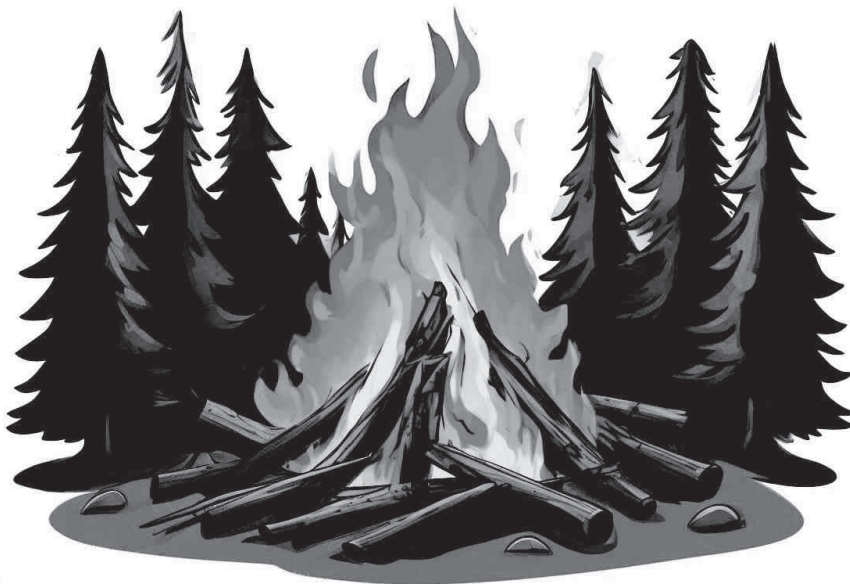
Иллюстрация создана при помощи нейросети Шедеруи

При тушении торфяного пожара учитывайте, что в зоне горения могут образовываться глубокие воронки, поэтому передвигаться следует осторожно, предварительно проверив глубину выгоревшего слоя.