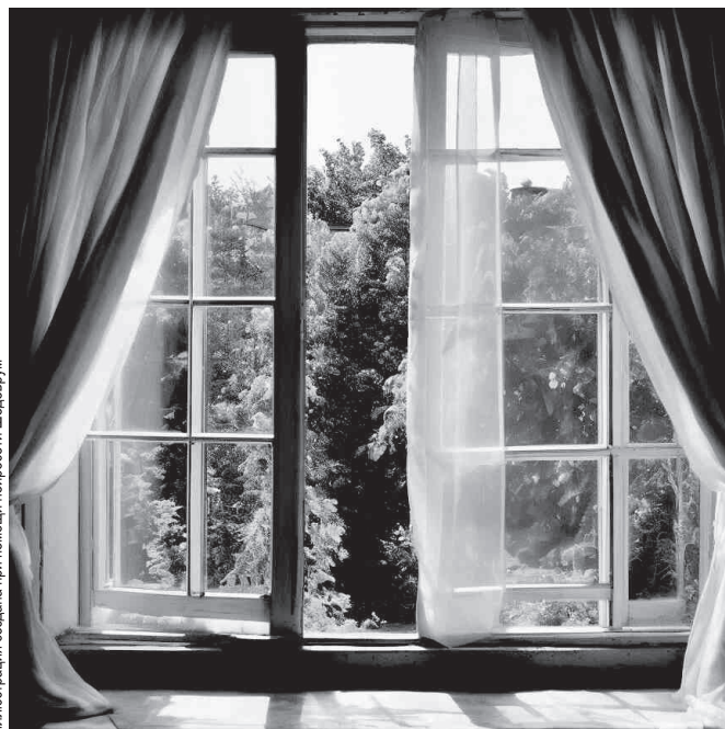
Иллюстрация создана при помощи нейросети Шедеврум

Прокуратура района призывает — уважаемые родители, во избежание негативных последствий не забывайте о простых правилах.