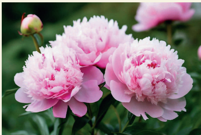
Иллюстрация создана при помощи нейросети Шедеврум